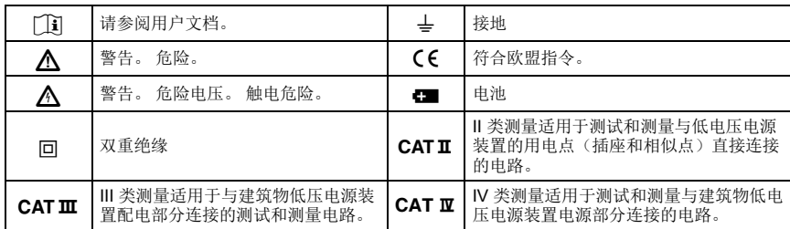
表 1. 符号